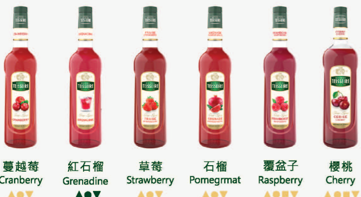
蔓越莓 Cranberry 紅石榴 Grenadine 草莓 Strawberry 石榴 Pomegranate 覆盆子 Raspberry 櫻桃 Cherry