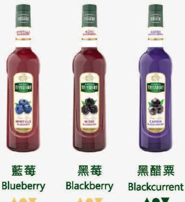
藍莓 Blueberry 黑莓 Blackberry 黑醋栗 Blackcurrant