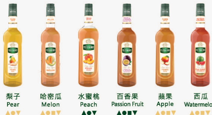
梨子 Pear 哈密瓜 Melon 水蜜桃 Peach 百香果 Passion Fruit 蘋果 Apple 西瓜 Watermelon