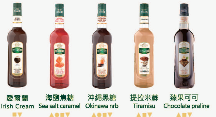
愛爾蘭 Irish Cream 海鹽焦糖 Sea salt caramel 沖繩黑糖 Okinawa nrb 提拉米蘇 Tiramisu 臻果可可 Chocolate praline