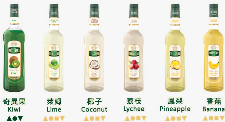
奇異果 Kiwi 萊姆 Lime 椰子 Coconut 荔枝 Lychee 鳳梨 Pineapple 香蕉 Banana