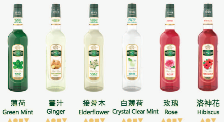
薄荷 Green Mint 薑汁 Ginger 接骨木 Elderflower 白薄荷 Crystal Clear Mint 玫瑰 Rose 洛神花 Hibiscus