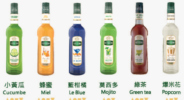
小黃瓜 Cucumbe 蜂蜜 Miel 藍柑橘 Le Blue 莫西多 Mojito 綠茶 Green tea 爆米花 Popcorn