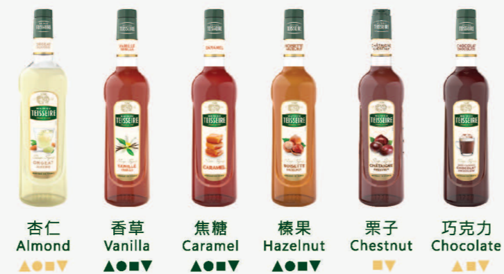
杏仁 Almond 香草 Vanilla 焦糖 Caramel 榛果 Hazelnut 栗子 Chestnut 巧克力 Chocolate